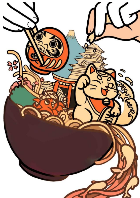
ภาพที่ 2 การลงสีเบส