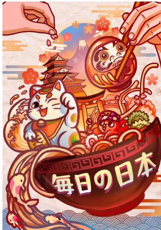
ภาพที่ 5 ตัวอย่างภาพผลงาน