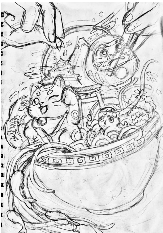
ภาพที่ 1 การออกแบบโครงร่าง