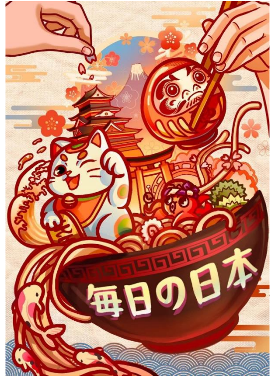
ภาพที่ 4 การตกแต่งสีพื้นหลังและตัวอักษร