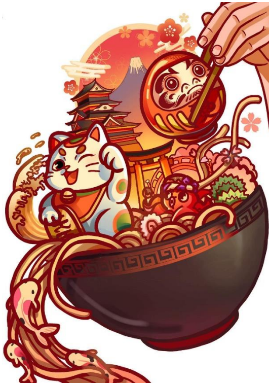
ภาพที่ 3 การลงสี